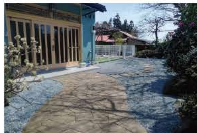
■外構デザイン設計・施工